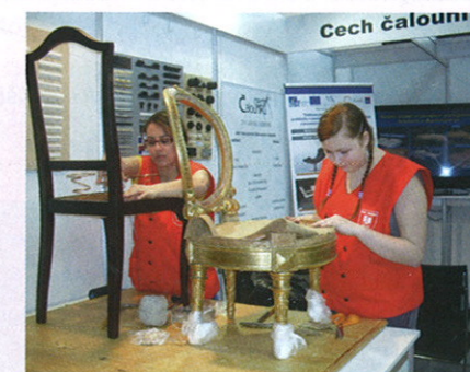
Ukázky čalounění ve stánku Cechu čalouníků a dekorátérů, MOBITEX 2011.

mistrovství 25.11.2011 v 17 hod. předá ing. Juránek, náměstek hejtmana Jihomoravského kraje pro školství, zástupci vybraného sociálního ústavu.