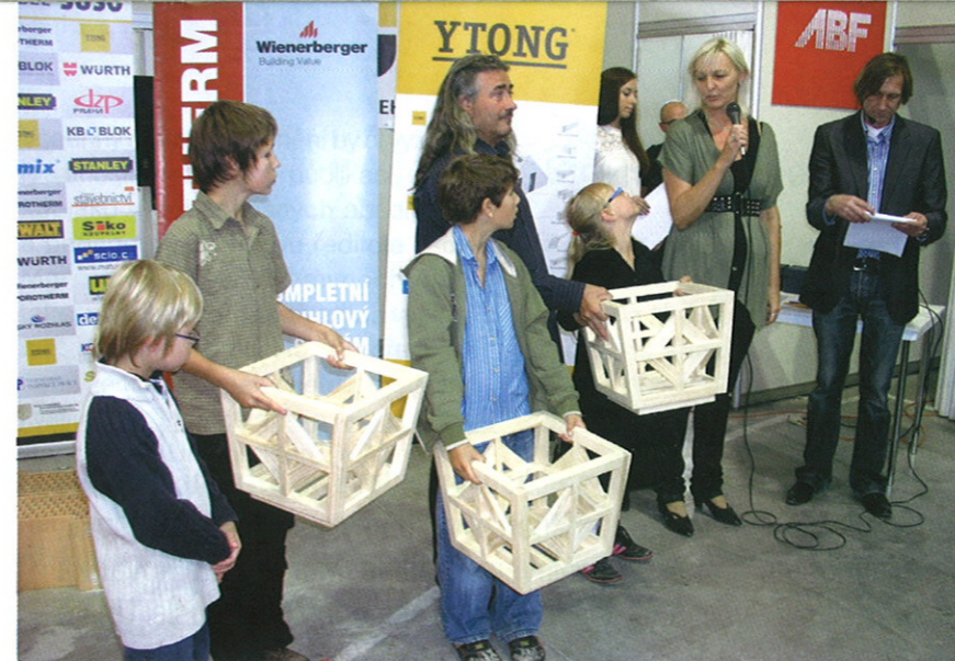
Hezkým zvykem se stalo předávání soutěžních výrobků mladých truhlářů zástupcům vybraného dětského domova

ceny v podobě profesionálního ručního a elektrického nářadí. Dalšími partnery jsou D.Z.P. Praha a Stanley.